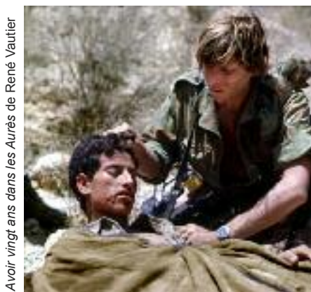
Avoir vingt ans dans les Aurès de René Vautier